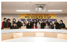
♥ 체험! 상담의 현장 속으로