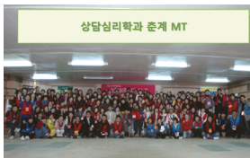
♥ 상담심리학과 MT