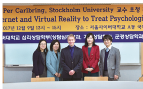
♥ 스톡홀름대학교 교수 특강