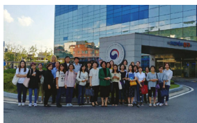
♥ 상담 및 임상 기관 견학 프로그램