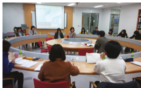
♥ 청소년 상담사 면접 시험대비 특강